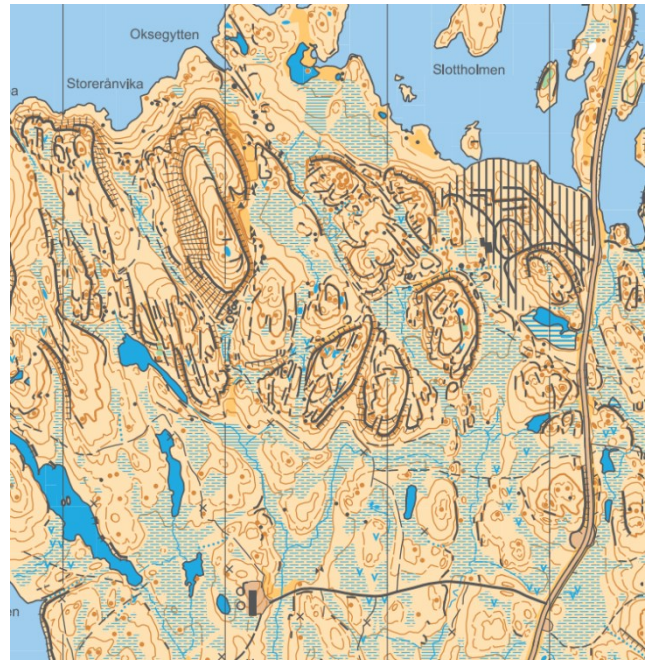
Utsnitt kart søndag