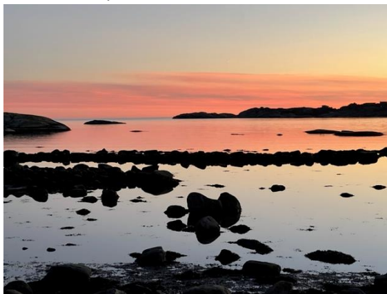
Utsikt fra løpsterrenget. Kl 18.20