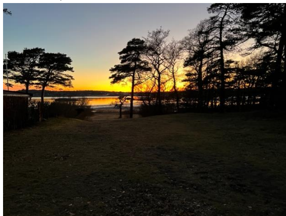
Fra arena kl 18.25 en uke før.

Det er 400 meter til start. Til start følger man en grusvei gjennom ett hyttefelt. For fellesstarten blir det ca 100 meter til startpunktet. Fristart fra 17:45 – 18:25. Fellesstart A-lang kl. 18:30 og A-mellom 18:35. Løpere som vil ha fellesstart i A-kort, starter rett etterpå.