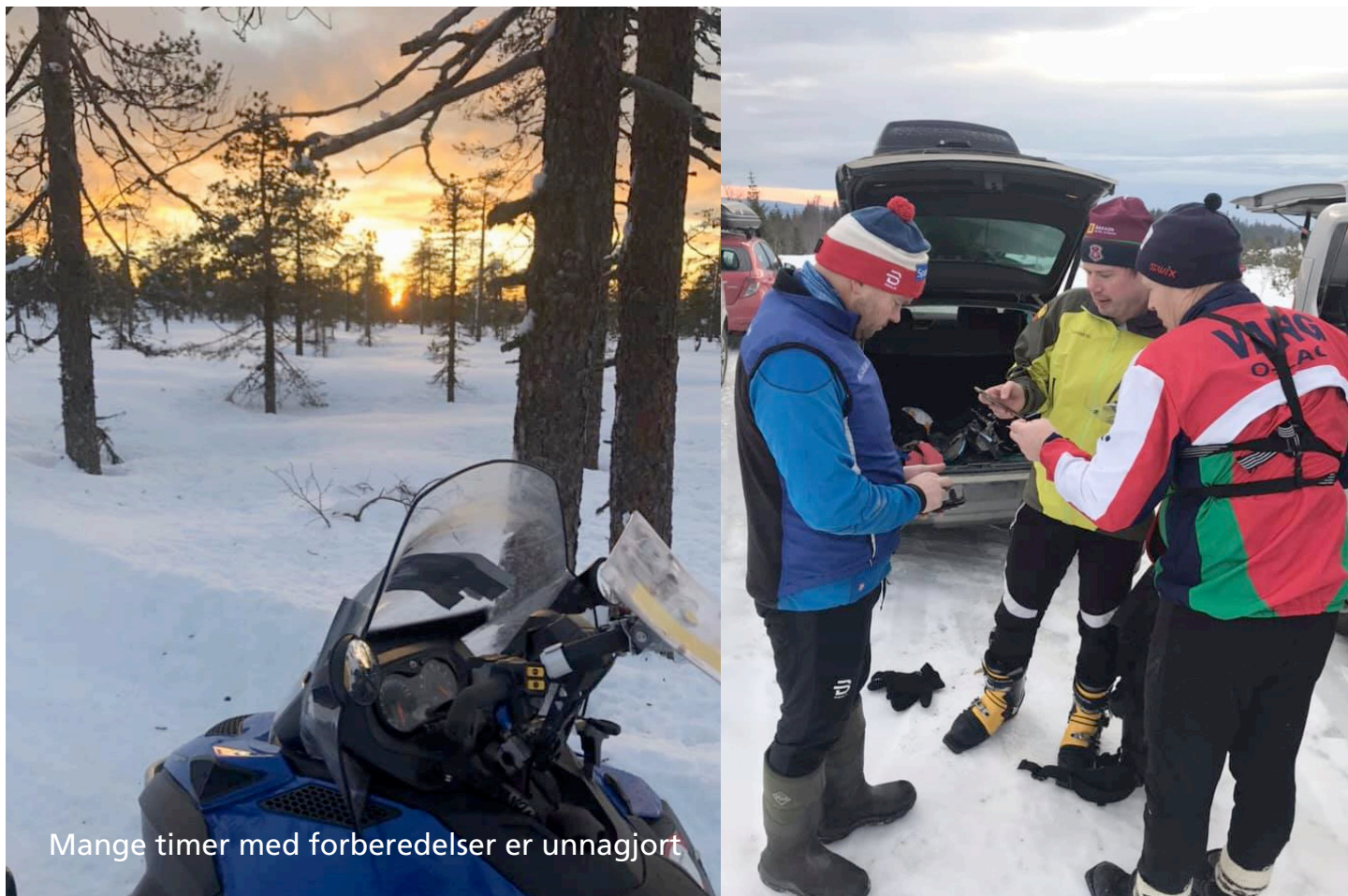
Mange timer med forberedelser er unnagjort

Start på skistadion for alle klasser. Det er 200 meter fra tidsstart til startpost.