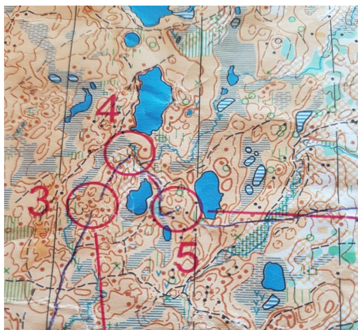
Skarvdalen – Dalsbygda