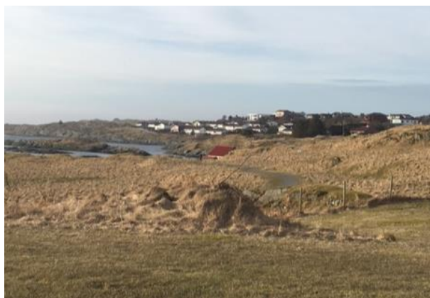
Samlingsplass og løpsterreng Vel møtt !