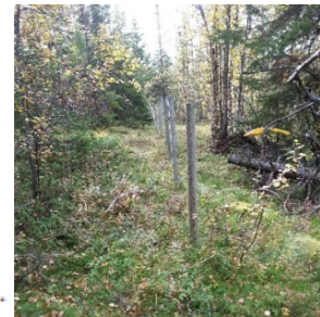
Eksempel på gammelt sauegjerde

523 Ruined fence A ruined fence may be shown with a dashed line. Colour: black.