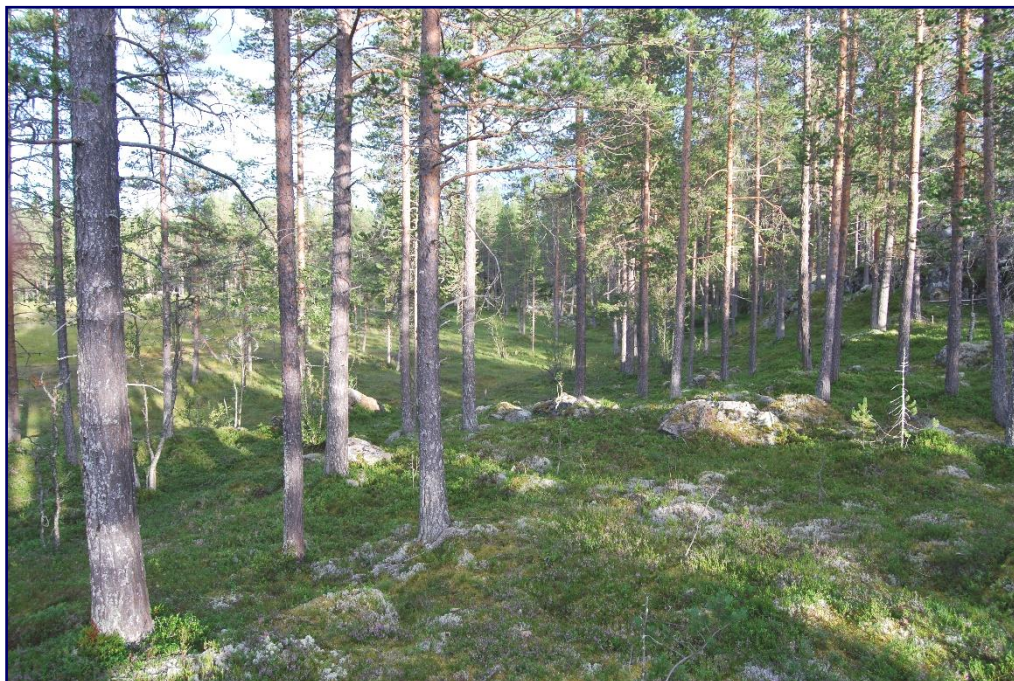
Bildeutsnitt fra løpsområdet